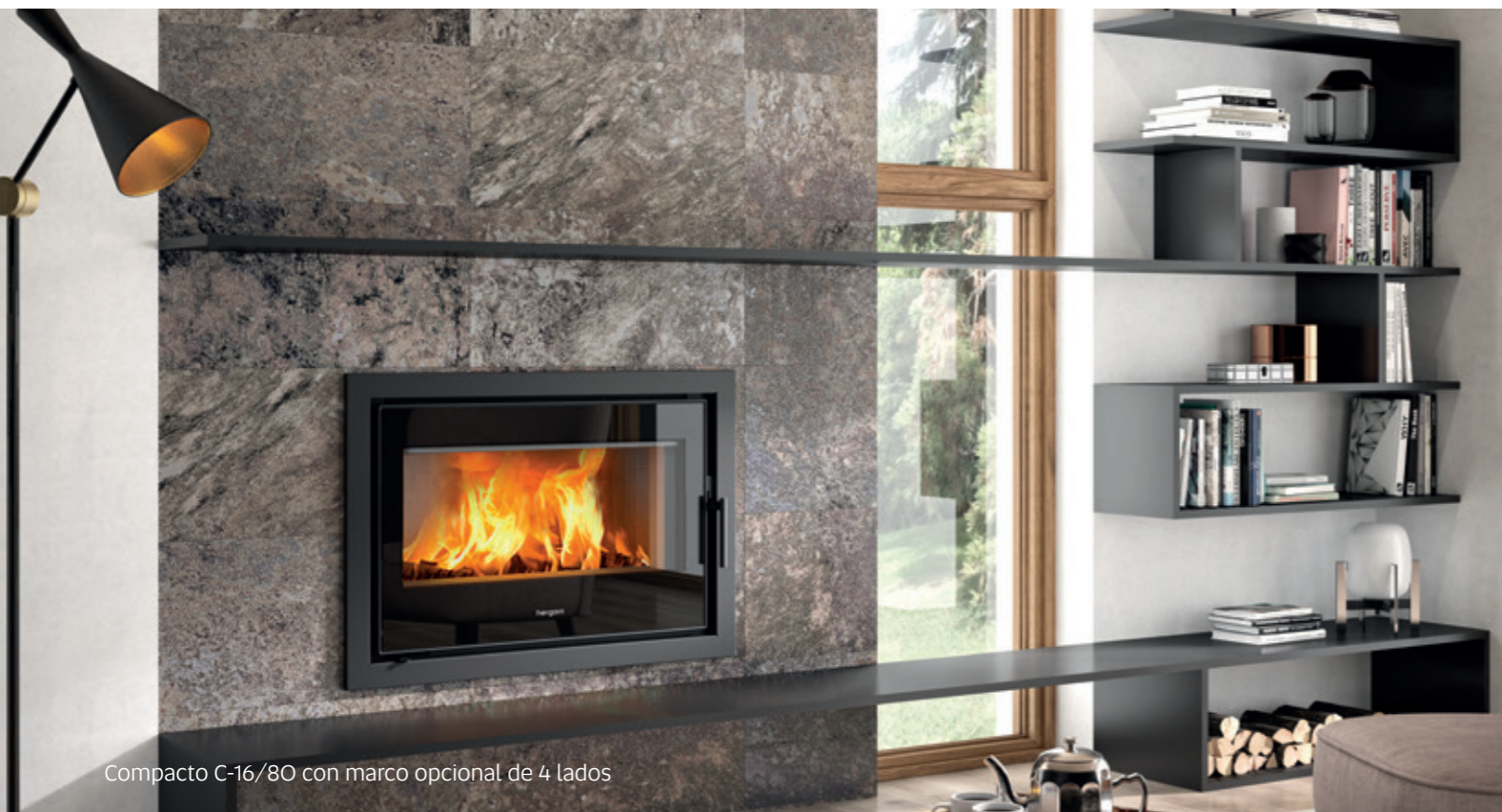
Compacto C-16/80 con marco opcional de 4 lados

Hergóm acaba de incorporar un nuevo Compacto a su catálogo, el C-16/80. Este producto cuenta con todas las garantías de la marca, pero suma prestaciones. Así, a su diseño moderno, de gran frente acristalado, se une una turbina de ventilación silenciosa, con tres velocidades, que es la encargada de proporcionar y distribuir eficazmente un gran caudal de calor por toda la estancia.