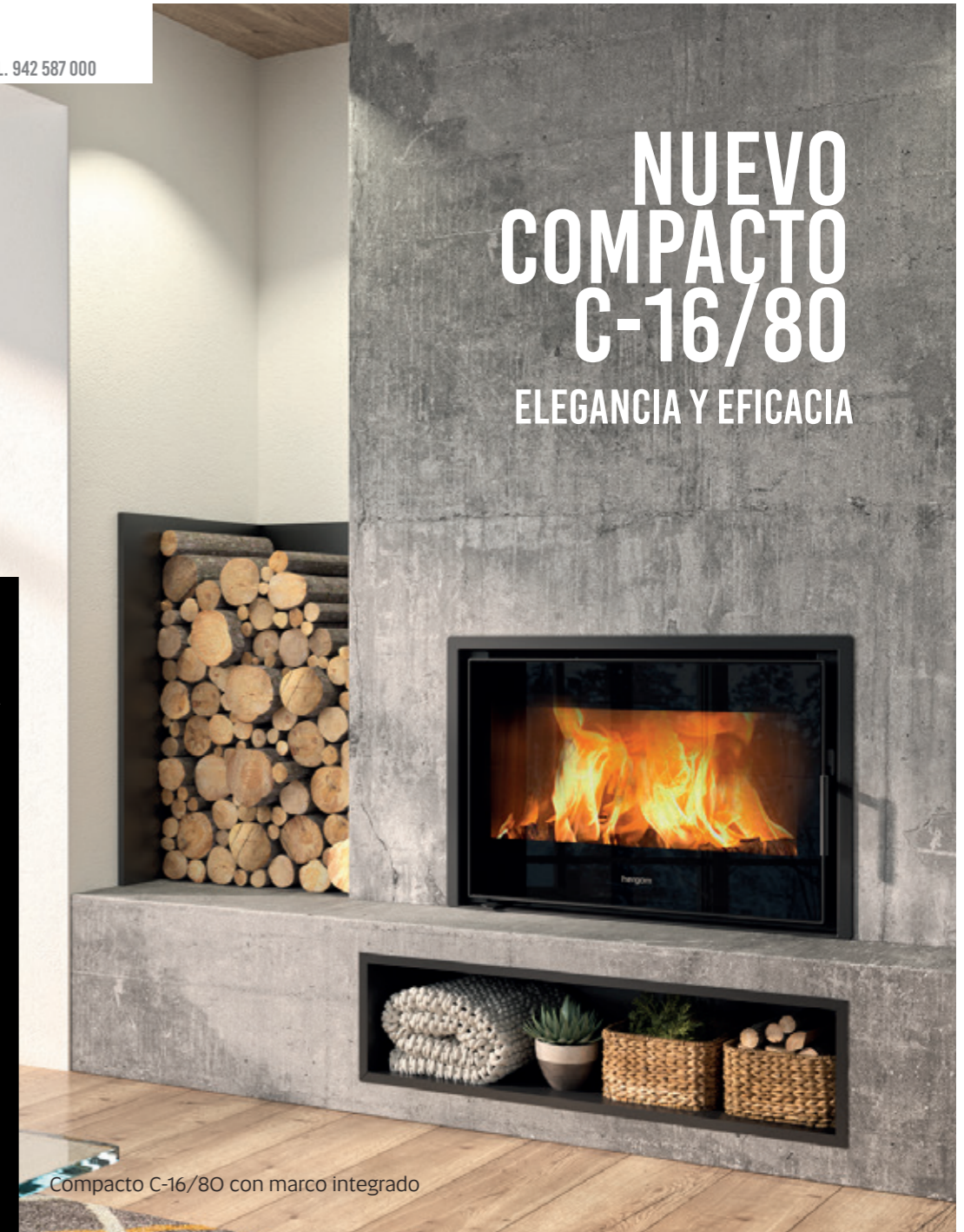
Compacto C-16/80 con marco integrado

NUEVO COMPACTO C-16/80 ELEGANCIA Y EFICACIA