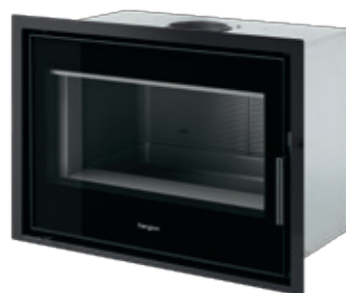
Compacto C-16/80 marco de hierro

A esta destacada característica se suman las habituales de la marca Hergóm, como su fabricación 100% en hierro fundido, cristal frontal con fijación invisible, control gradual del aire de combustión o sistema "airwash" de cristal limpio, entre otros.